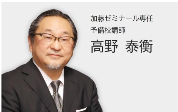
加藤ゼミナール専任 予備校講師