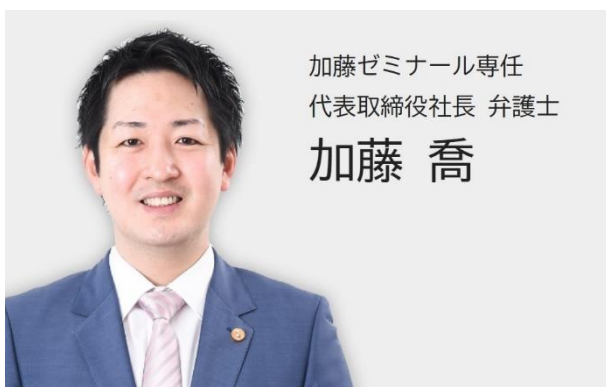
加藤ゼミナール専任 代表取締役社長 弁護士